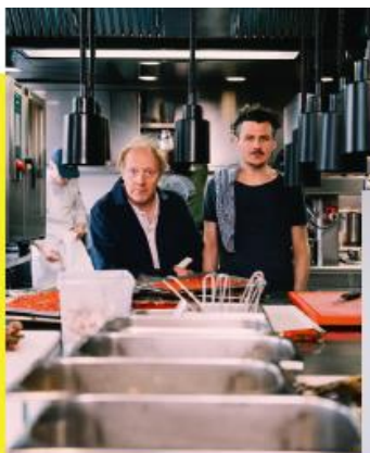
Do, 6.6.2024 Rubey & Schwarz „Das Restaurant“